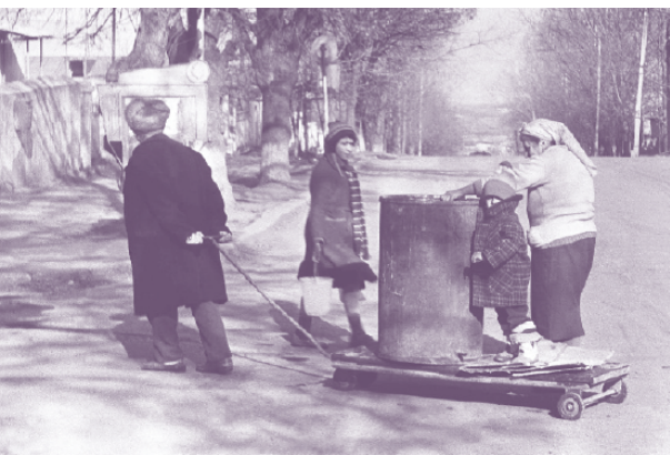
Арменпресс. Степанакерт в 1992 году.

результате в 1989 году Мецаморская электростанция была остановлена. После обретения страной независимости и с началом войны Турция и Азербайджан закрыли границы с Арменией и наложили на страну топливное эмбарго. В то же время Азербайджан перекрыл проходивший через его территорию газопровод из Туркменистана, перекрыв таким образом около 90% поставок природного газа в Армению, а поставки из нового газопровода, построенного в 1993 г. через соседнюю Грузию, регулярно прерывались актами саботажа. В период с 1992 по 1996 год потребители пережили несколько суровых зим в Армении с электричеством немногим более двух часов в день 3 .