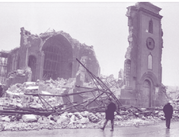
Храм Христа Спасителя в Ленинкане после землетрясения в Армении 7 декабря 1988 года

Еще до обретения независимости промышленность Армении резко пришла в упадок, и стране был нанесен серьезный удар по экономике. Во-первых, Спитакское землетрясение 7 декабря 1988 г. не только привело к гибели 25 000 человек, 530 000 человек остались без крова и тысячи стали инвалидами, но и уничтожило 1/3 промышленных мощностей страны. Затем ВНД приступило к быстрым политическим, правовым и экономическим реформам, направленным на переход от однопартийной политической системы и плановой экономики к либеральной демократии и рыночной экономике.