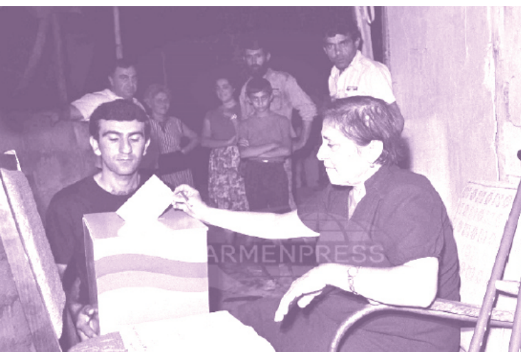
Армянка голосует на референдуме о независимости Армении. 21 сентября 1991 года.

Переходный период в Армении во многом был сформирован карабахским движением и последовавшей за ним войной, Спитакским землетрясением, длительной блокадой и значительным социально-экономическим спадом. Основанное в 1988 году карабахское движение представляло собой большое гражданское движение в Армении и состояло из населенной преимущественно армянами Нагорно-Карабахской автономной области, выступавшей за передачу Карабаха из соседней Азербайджанской ССР в Армянскую ССР. Перерастая в народное демократическое начинание, руководство движения «Ка-