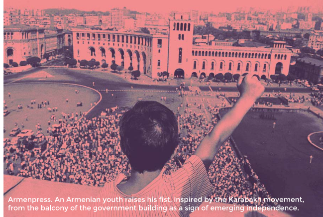
An Armenian youth raises his fist, inspired by the Karabakh movement, from the balcony of the government building as a sign of emerging independence.