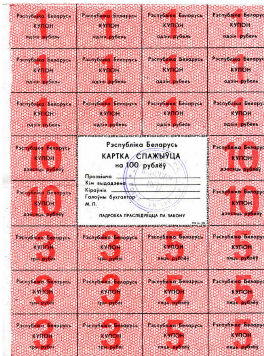
Купонная карточка потрэбителя, введённая в Беларуси с января 1992 г.