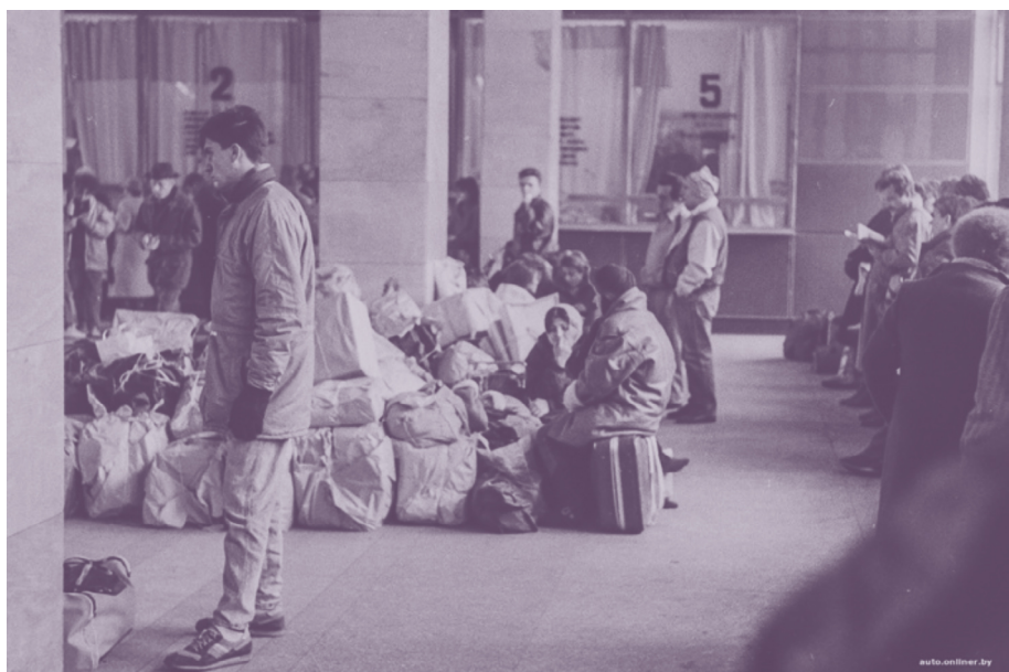
«Челноки» на вокзале. 1990-е годы.