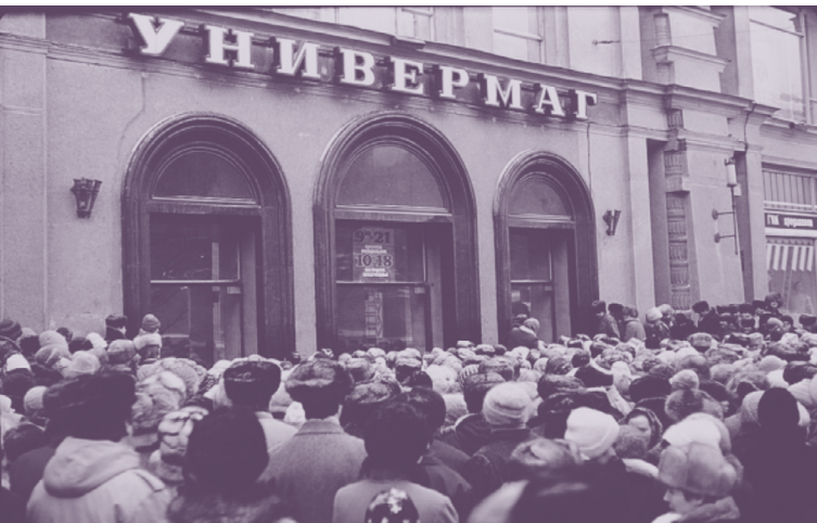
Николай Агафонов. Покупатели у магазина. Минск. Гум. Февраль 1990 г. https://6x9.by/001ru.html