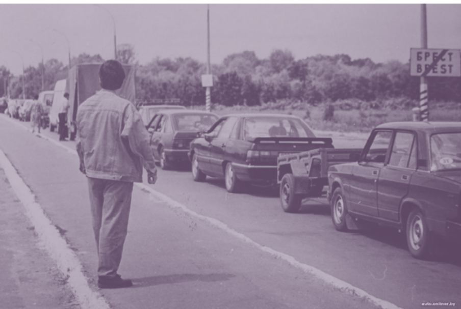
Очередь «челноков» на выезд из Беларуси. 1990-е годы.