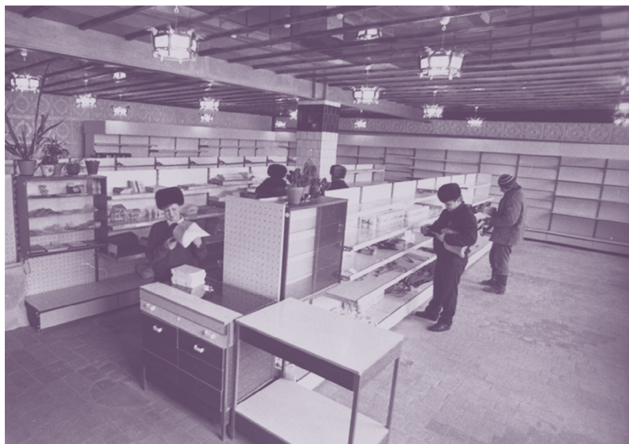
Пустые прилавки магазинов. Начало 1990-х годов.