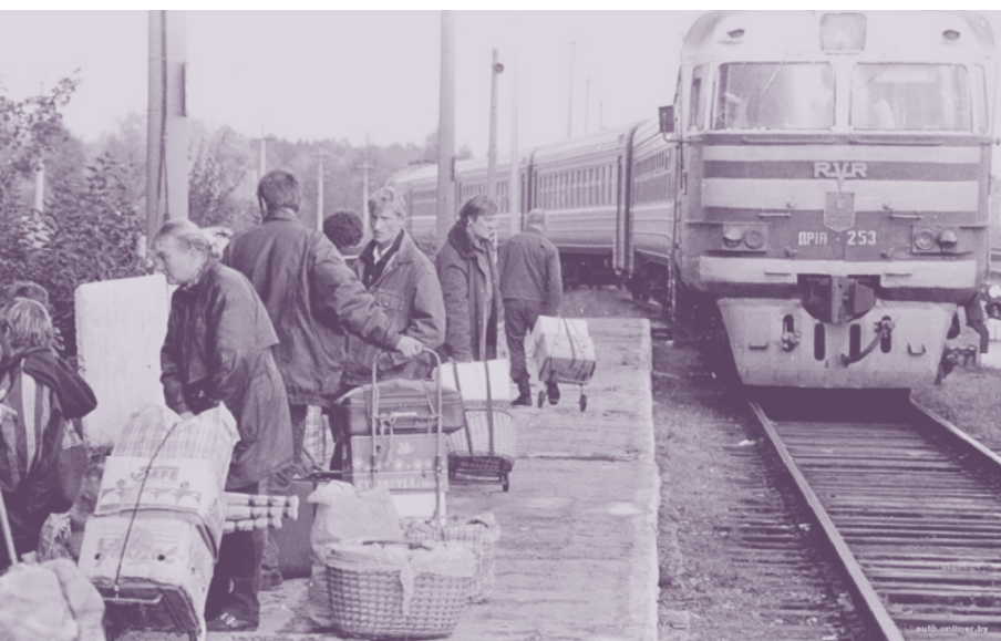
«Челноки» ждут поезда. 1990-е годы.