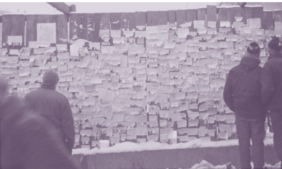
Николай Агафонов. Объявления на заборе. Минск. Начало 1990-х годов. Подобным путём люди искали работу и предлагали товары на продажу.