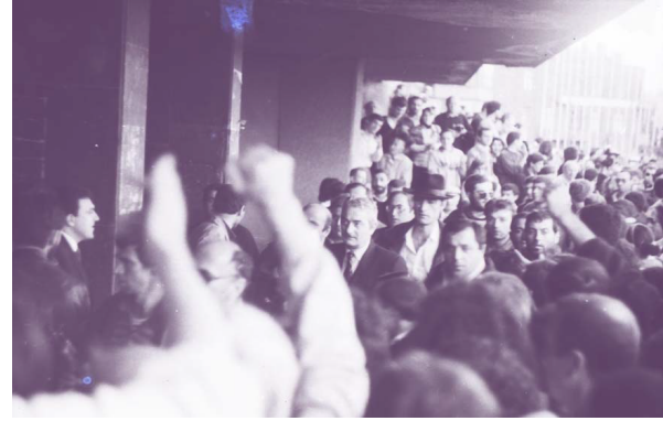
Массовая демонстрация и гражданская стычка на улице Тбилиси, 1991 год.